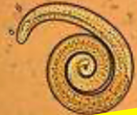
Larve de Trichine

Sur notre territoire, un des vecteurs principaux pour l'Homme est le sanglier qui consomme, à l'occasion, de la viande. Il est ensuite consommé par l'Homme et transmet ainsi la maladie. Le porc ainsi que le cheval peuvent aussi transmettre la Trichinellose.